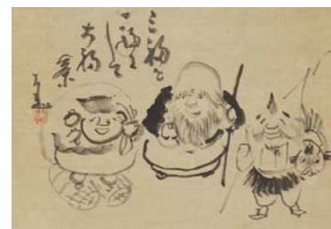
三福大福茶図 仙厓筆 福岡・聖福寺

江戸時代に活躍した禅僧で、数多くの禅画と墨蹟を遺した白隠さんと博多の仙厓さん。ともに庶民への布教につとめ、江戸時代の禅宗界に新風を巻き起こしました。本展では、九州に遺る二人の代表的な禅画や墨蹟を中心に展示し、彼らのユーモアあふれる禅の心を紹介しました。