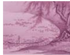
◀ 国宝 周茂叔愛蓮図(しゅうもしくくあいれんず) [部分]

初の、水墨画に焦点をあてた企画です。国宝1件・重要文化財2件を含む名品13件をお披露目します。モノクロームの世界が紡ぎだす水墨画の魅力をご堪能ください。