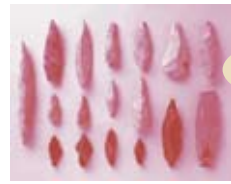
12月4日(日) ワークショップ「石器作り体験」開催!

九州各地の狩人の様々な石槍をはじめ、彼らが追ったナウマンゾウやオオツノジカなどの化石も併せて紹介します。特に長崎県福井洞穴出土の九州最古級の石器は、50年ぶりの里帰りです。西日本初公開!