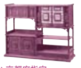
▲ 京都府指定 黒漆塗人物図飾棚