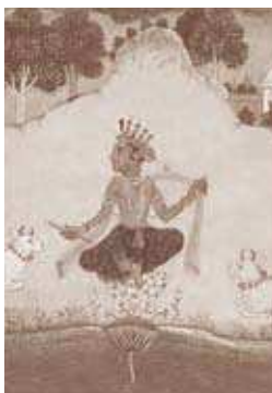
▲蓮の上に坐すクリシュナ

インド・ムガル王朝時代の華やかな更紗(さらさ)と細密画を紹介します。バラエティに富んだインドの染織と細密画を通して、当時の流行や人々の信仰のあり方に触れてみてください。