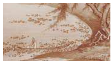
▲国宝 周茂叔愛蓮図[部分](しゅうもしゆくあいれんず)

水墨画は、アジアが世界に誇る芸術です。今回は館蔵品から国宝1件・重要文化財2件を含む名品13件を展示し、モノクロームの世界が紡ぎだす水墨画の魅力を紹介します。