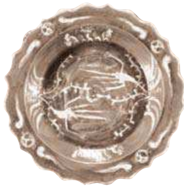
▲三彩魚藻文盤(さんさいいぎょうそうもんばん)

当館では毎年秋に「茶の湯を楽しむ」としてその豊かな世界を紹介してきました。茶の湯では中国などの工芸品などが多く使われてきました。今年はそのような作品に目を向けて、茶の湯に見る国際交流の様子をご覧ください。