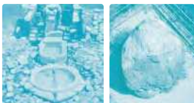
▲亀形石造品 (かめがたせきぞうひん)

九州最西端の平戸は地理的な条件から古くより海上交通の要衝であり、中国大陸や朝鮮半島、そして中・近世には西洋との交易の窓口として繁栄しました。その平戸の海外交流を示す資料の数々をご覧ください。