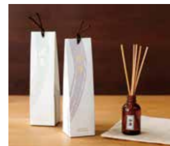
香木ディフューザー 1,320円~1,760円(税込)

古来より伝わる香原料を忠実に再現した「香木ディフューザー」。上品な白檀、重厚な沈香、神秘的な龍涎香、高貴で重厚な伽羅の4種が店頭並びます。