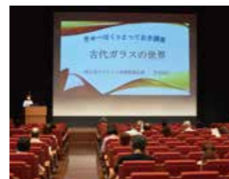
※写真は第1回講座「古代ガラスの世界」

ミュージアムホールでは、大画面を使ったお勧め作品の特別解説講座を定期開催し、文化財の魅力を熱い想いでお伝えしています!開催日・講座テーマの詳細は、九博ホームページでご確認ください。