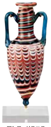
アンフォリスコス