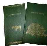
九博オリジナル野帳