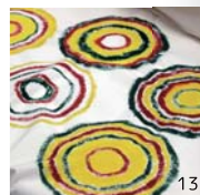
3期生の活動：1. 絶品！古代食 2. 古墳の石室の中で埋葬気分 3. 橿名古墳（うきは市）を見学 4. ベニバナ染め 5. どんぐりの見分けかた 6. 王塚古墳（桂川町）を散策 7. 板付遺跡で古代食作り 8. 吉野ヶ里遺跡ツアー 9. 3Dプリンタで作られた鏡をさわる 10. 土器洗いに挑戦 11. 狩り体験 12. 鹿角のネックレス 13. 貴顕衣に描かれた古代文様 14. 太宰府遺跡巡りツアー