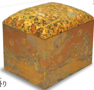
国宝 初音蒔絵寄り掛り

※国宝三件全て 江戸時代・寛永16年(1639) 徳川美術館