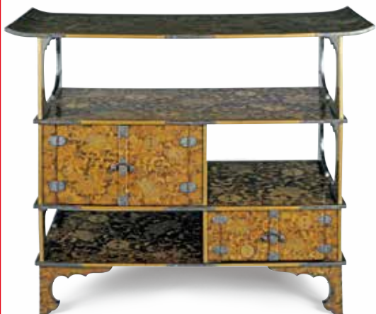
濃梨地牡丹唐草向鶴紋散蒔絵調度のうち