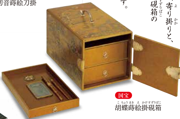
国宝 胡蝶蒔絵掛硯箱

※国宝三件全て 江戸時代・寛永16年(1639) 徳川美術館