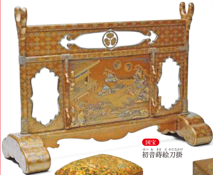
国宝 初音蒔絵刀掛