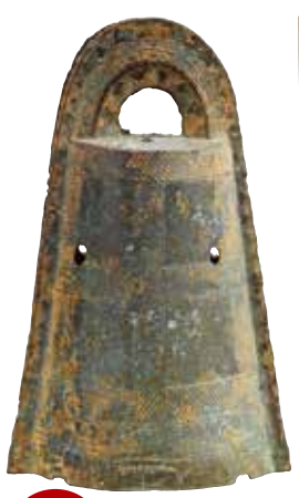
重要美術品 四区袈裟禪文銅鐺 弥生時代(前2-前1世紀)