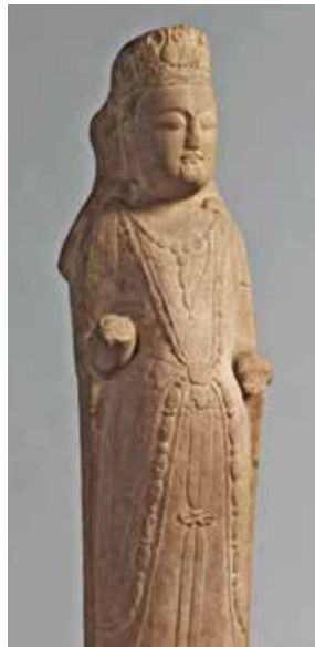
観音菩薩立像 中国 北斎時代(武平7年(576))