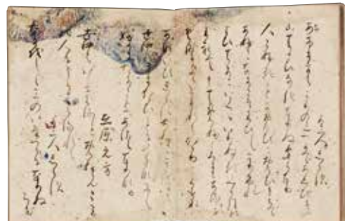
古今和歌集 伝藤原公任筆 平安時代(12世紀)