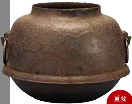
重要美術品 梅竹の図真形釜 室町時代(15世紀)