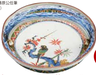
重要美術品 色絵花鳥図手付鉢 江戸時代(17世紀中葉)