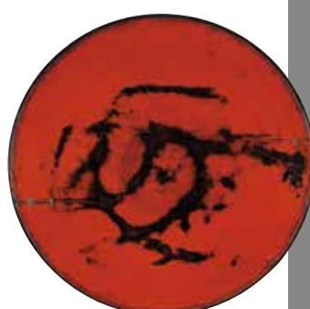
朱漆練行衆盤 鎌倉時代(13世紀)