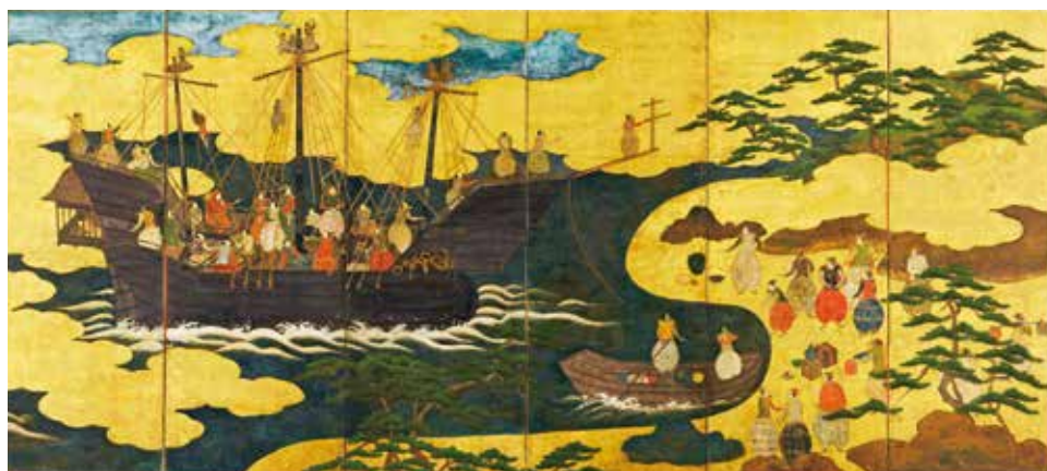
南蛮屏風 江戸時代(17世紀)

坂本五郎氏 プロフィール 大正12年(1923)横浜生まれ。昭和22年(1947)古美術商「不言堂」設立後、国内外の美術市場で活躍。昭和47年(1972)、ロンドンの競売で中国・元時代の青花釉裏紅大壺を当時世界最高額で落札し、一躍有名となる。平成28年(2016)東京にて死去。