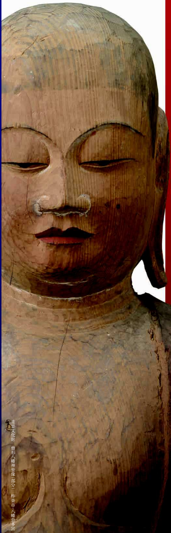
重要文化財 僧形八幡神坐像(部分) 杵築市八幡奈多宮