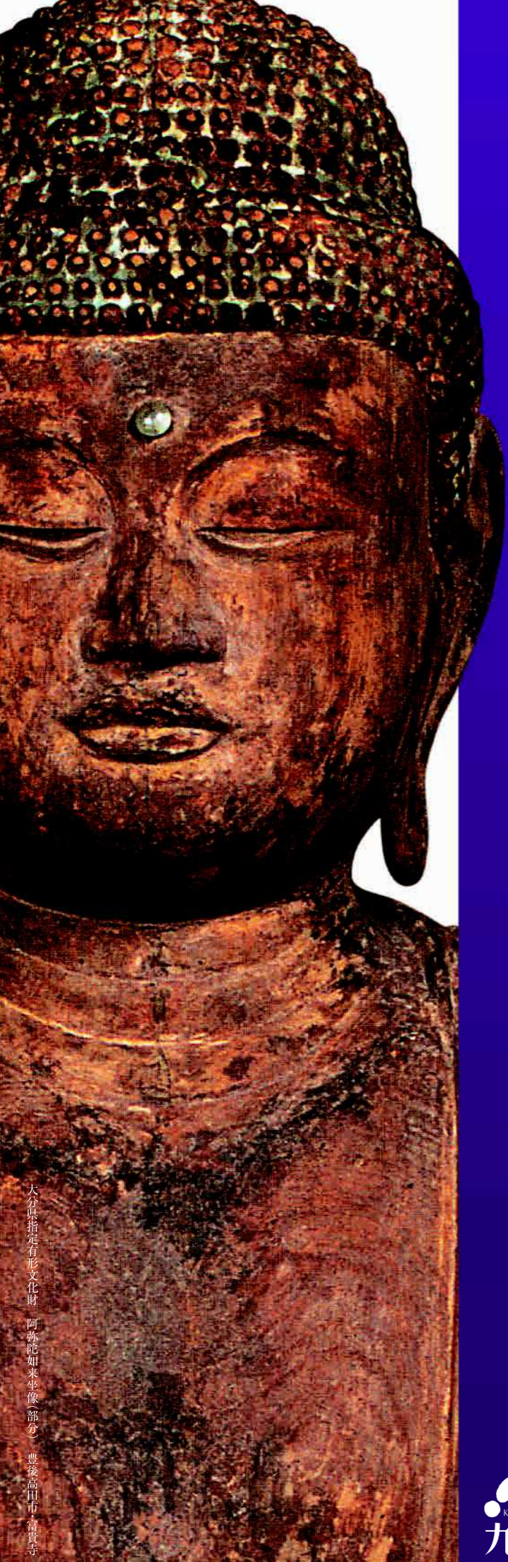
大分県指定有形文化財 阿弥陀如来坐像(部分) 豊後高田市高貴寺