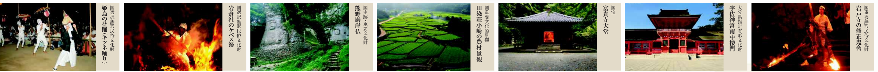
国東半島無形民俗文化財 岩戸寺の修正鬼会

大分県指定有形文化財 阿彌陀如来坐像および 観音菩薩・勢至菩薩立像 平安時代 十一世紀 豊後高田市・富貴寺