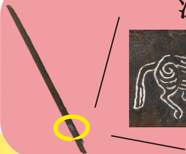
江田船山古坟 银镶嵌大刀（复制品）