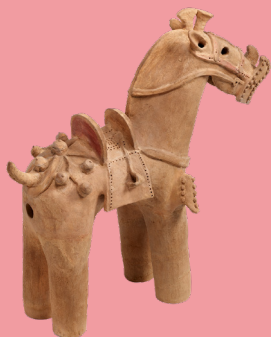
埴轮 马 6世纪 九州国立博物馆