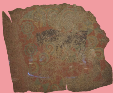
王冢古坟壁画临摹