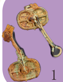
1 衔与镡 2 杏叶（马具） 福冈 宫地岳神社