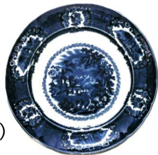
江戸時代 1863年頃 九州国立博物館 (服部和彦氏寄贈)

イギリスやオランダのプリントウェアは18世紀後半以降、日本に数多く渡り、長崎を中心に日本各地で流行しました。その人気ぶりに、瀬戸や京都でもそのデザインを模倣した藍絵製品が作られました。長崎の豪商がカステラをのせていたかも？