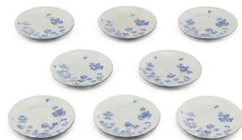
江戸時代 享保21年 (1736) 九州国立博物館 (阿形邦三氏寄贈)