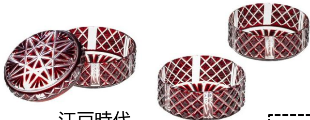
江戸時代 19世紀 九州国立博物館