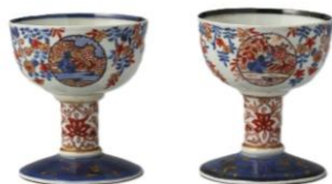
江戸時代 18世紀 小郡C.C. コレクション