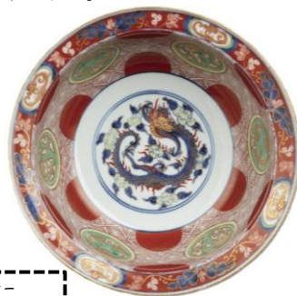
江戸時代 17~18世紀 田中丸コレクション