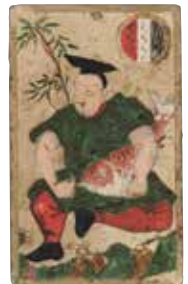
ウンスカルタの札(一部)

全問書けたら1Fきゅーはくミュージアムショップのレジにもっていこう!(順番に並んでね)