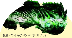
물고기무늬 넓은 굽다리 잔 (일부분) 에밀 갈레, 프랑스, 1895년 - 1904년 기타자와미술관