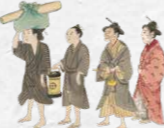
白地御絵図柄苧麻衣裳 第二尚氏時代・19世紀 沖縄県立博物館・美術館 展示期間:8/9(火)~9/4(日)