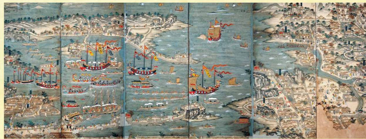
浦添市指定文化財 琉球交易港図屏風 第二尚氏時代・19世紀 浦添市美術館 展示期間:8/9(火)~9/4(日)