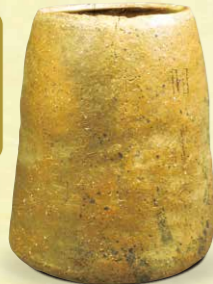
壺 八重山、パナリ焼 第二尚氏時代・17~18世紀 九州国立博物館