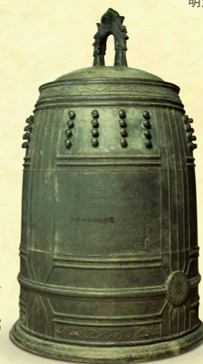
銅鐘 旧首里城正殿鐘(万国津梁の鐘) 藤原国善作 第一尚氏時代・天順2年(1458) 沖縄県立博物館・美術館