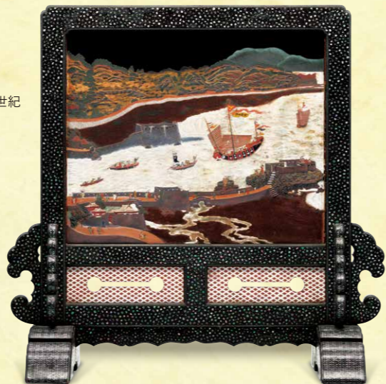
黒漆首里那覇港図堆錦螺鈿衝立 [原画]比嘉華山 [木地制作]玉城サンルー [髹漆・加飾]友寄英茂、亀島汝翼ほか 昭和3年(1928) 鹿児島県歴史・美術センター黎明館