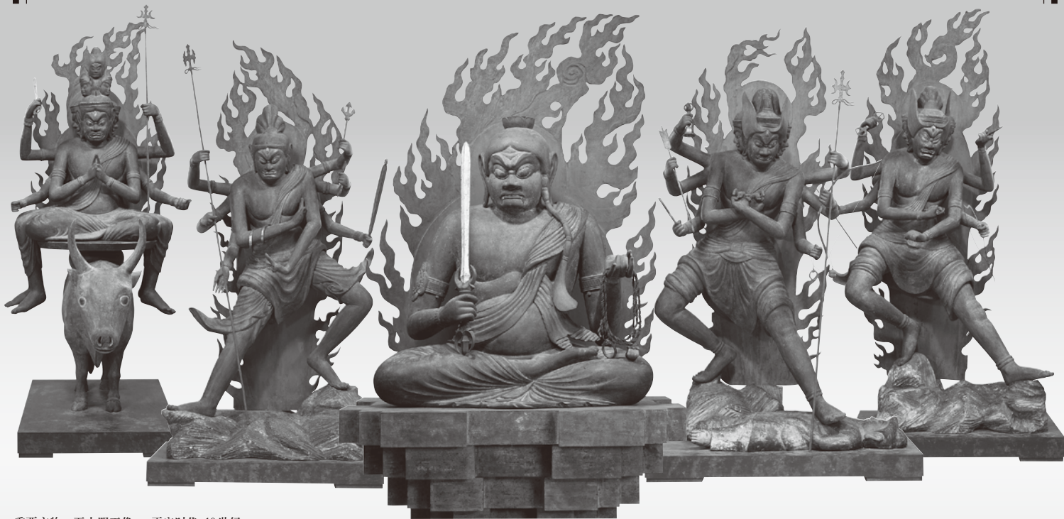
重要文物《五大明王像》平安时代 10世纪

中国西安青龙寺，是日本密宗的源流之所。日本僧人空海大师，曾在此师从惠果和尚学习密教，回到日本后开创了日本真言宗。其直系弟子理源大师圣宝开创了醍醐寺，传授空海大师的教诲，此寺至今已有千年以上的历史。本次展览从醍醐寺的15万件宝物中，遴选了104件进行展示。邀您欣赏起源于唐朝的充满魄力的密教艺术！