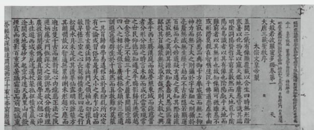
国宝《宋版一切经》中国南宋 12世纪