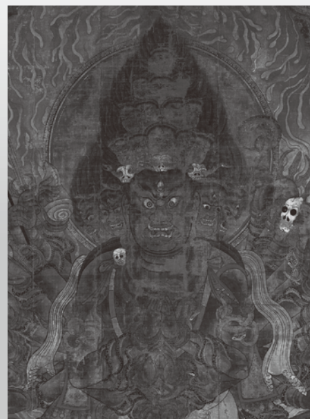
重要文物《太元护法本尊像 太元帅明王像(三十六臂)》镰仓时代 14世纪