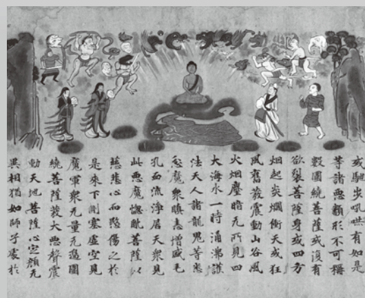
国宝《绘因果经》奈良时代 8世纪