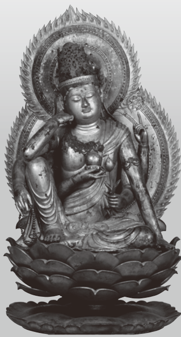
重要文物《如意轮观音坐像》平安时代 10世纪