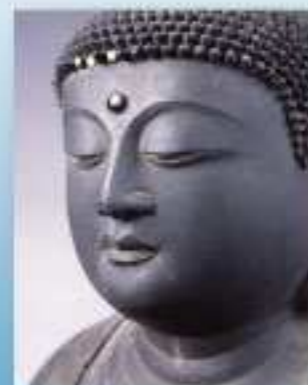
重要文化財 木造羅刹如来坐像 (興隆寺 大津市)