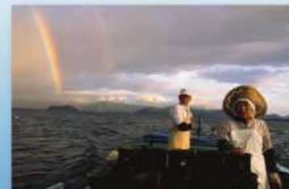
湖上の漁舟 (夕つべ漁)