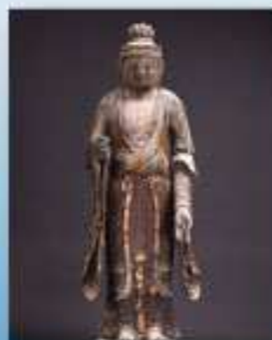
重要文化財 木造梵天立像 (浄水寺 鎌倉市)

夜明けの光が散乱する湖面や、日没の時に浮かび上がる、 なだらかな墨色の山々の姿を見たとき、何ものかに手を合わせ拝みたくなる。 滋賀には、こんな気持ちにさせる風景が数多く残されている。 太陽と月の光で暮らす、古代よりこの地に住みついた人々は、 山と湖に結びついた祈りの形を像に託したのだろうか。 ほの暗いお堂の中に、数多くの仏像がひっそりと残されており、 力強さや温かいまなざしが心に刻まれる。 いつ訪れても静かな時間が流れ、そこを立ち去り難い気持ちになるのである。 ——寿福 滋 (文化財写真家)——