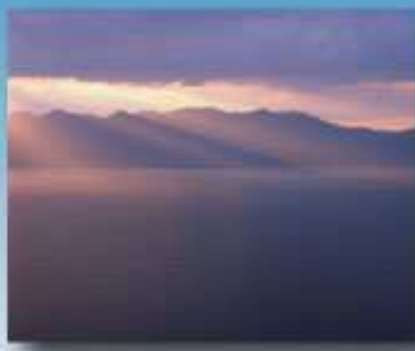
夕暮れの比良山系 (大津市)