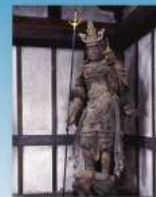
重要文化財 木造聖母天立像 (石山寺 大津市)