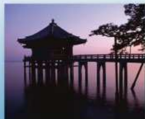
神 堂 (海津山月寺 大津市)