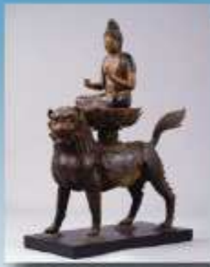
重要文化財 木造工務菩薩坐像 (興隆寺 大津市)