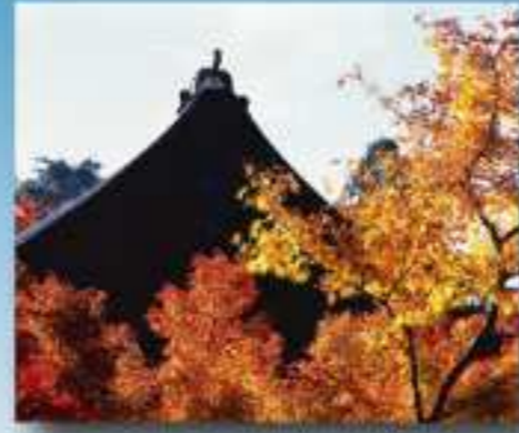
金剛輪中の紅葉 (愛宕町)