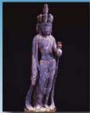
国宝 木造十一面観音立像 (国宗寺 鎌倉市)