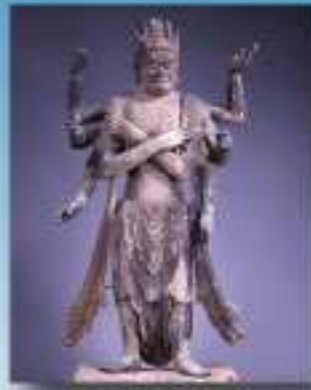
重要文化財 木造金剛明王立像 (金勝寺 鎌倉市)