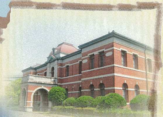
新日本製鐵八幡製鐵所 ※非公開施設