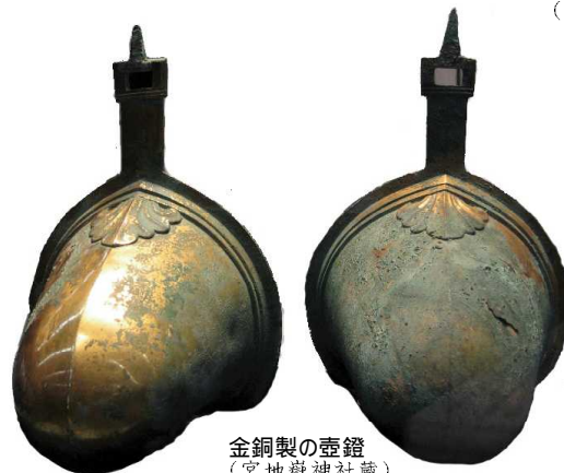
金銅製の壺鏡 (宮地嶽神社蔵)