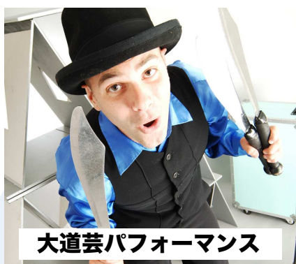
大道芸パフォーマンス