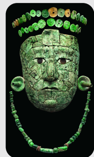
赤の女王のマスク・冠・首飾リマヤ文明、7世紀後半ハレンケ、13号神職出土アルベルト・ルス・ルイエハレンケ遺跡博物館

X(旧twitter)で「#古代メキシコ展」をつけて投稿 or フォロー&RTで抽選で3名様に 展覧会オリジナルグッズをプレゼント!!