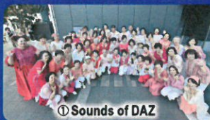
① Sounds of DAZ