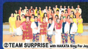
② TEAM SURPRISE with HAKATA Sing For Joy

時間：①14時40分～ ②16時00分～ 場所：九州国立博物館 1階ミュージアムホール