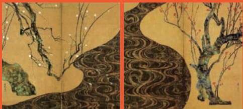
[国宝]紅白梅図屏風

本美術館は「美術品を一人でも多くの人に見せ、楽しませ人間の品性を向上させる事こそ文化の発展に大いに寄与する」「日本の優れた伝統文化を世界の人々に紹介したい」との創立者の願いを継承し、全国の児童作品展をはじめ、生け花教室、小学校や公民館での美育セミナー等、幅広い文化活動を展開しています。