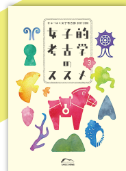
「女子考古学のススメ」

*数に限りがあるワークショップもあります。詳細はホームページなどでご確認ください。 *内容は予告なく変更する可能性があります。ご了承ください。