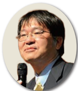
河野一隆 (九州国立博物館)