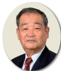
三輪嘉六 (前九州国立博物館長)