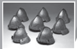
金箔押桃形兜 福岡・立花家史料館

時間 10時00分~12時00分 13時00分~15時00分 場所 九州国立博物館1階 エントランス 参加料 無料 申し込み 不要 年齢制限 なし