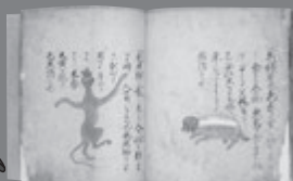
はりきぎがせ 針聞書