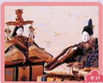
平戸 (松浦史料博物館)