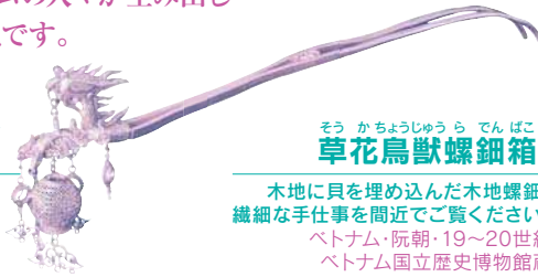
そう かちようじゅうら でんばこ 草花鳥獣螺鈿箱

華麗なデザインと金工技術の高さには目を見張るものがある。 ベトナム・黎朝・18世紀 ベトナム国立歴史博物館蔵