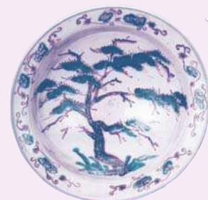
てつ えりよくさいしやうじゆもん おおひらばち 鉄絵緑彩松樹文大平鉢