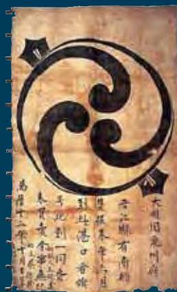
西国の雄 毛利輝元のアジア戦略 重要文化財 日明貿易船旗 安土桃山時代・天正12年 明時代・万暦12年(1584) 個人蔵