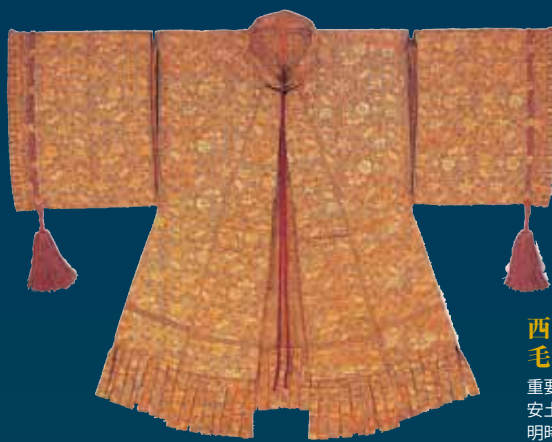
黒田家の華 南蛮モードの陣羽織 金襴軍袍 安土桃山時代・16-17世紀 福岡市美術館蔵

九州北部の覇者にして遙かなる世界を見すえた大友宗麟、その強力なライバルである毛利元就・島津義久・龍造寺隆信、豊臣秀吉の時代に活躍した立花宗茂・鍋島直茂・小早川隆景・黒田長政・加藤清正・小西行長など、本展覧会の主人公は一人ではありません。各大名家・菩提寺などで大切に守り継がれてきた肖像画、武器、甲冑類、遺愛道具のほか、海外交流にまつわる貴重な品々が、九州を舞台として繰りひろげられた大名たちの物語へとつながります。