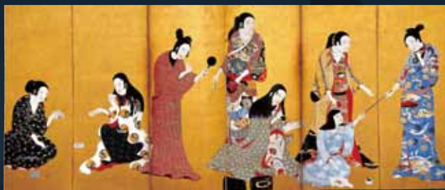
松浦家の逸品 開館時の感動が再び 2週間限定公開(5/19-5/31) 国宝 婦女遊楽図屏風(松浦屏風) 桃山-江戸時代・17世紀 大和文華館蔵