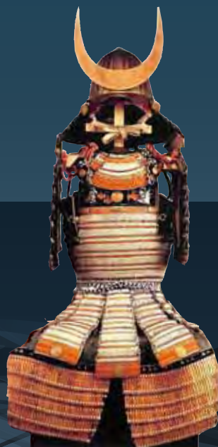
九州の雄 大友家の伝統と格式 重要文化財 白檀塗浅葱糸威腹巻 室町時代・16世紀 柞原八幡宮蔵

2015年 4月21日(火)~5月31日(日) 休館日:毎週月曜日 ※ただし、5月4日(月・祝)は開館。 開館時間:午前9時30分~午後5時 (入館は午後4時30分まで)