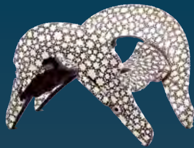
悲運の将 小西行長の面影 梅花皮写象牙鞍 安土桃山時代・16世紀 個人蔵