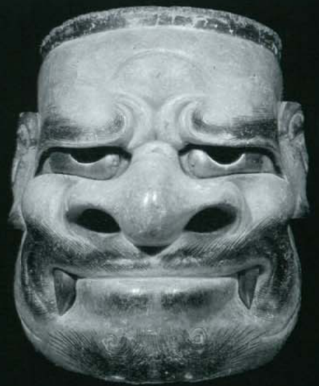
牙癒見・KIBABESIMI(三井文庫蔵)

能楽は世界無形文化遺産にも認められた、日本の誇るべき伝統芸能です。今回の能楽講座は、伝える事の大切さを第一に考え、皆様方に解りやすく、やさしく解説。子どもから大人まで楽しんで頂けます。この機会に是非、能の世界へ足を踏み入れてみて下さい!