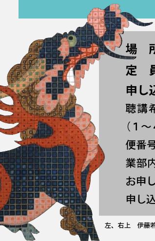
左、右上 伊藤若沖「鳥獣花木図屏風」(右隻)(部分)

〒818-0118 福岡県太宰府市石坂4-7-2 http://www.kyuhaku.jp